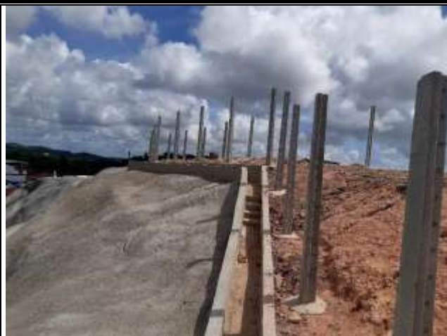
Cerca com Mourões no cume entre as barreiras de Santo Antônio e Coqueirinho.