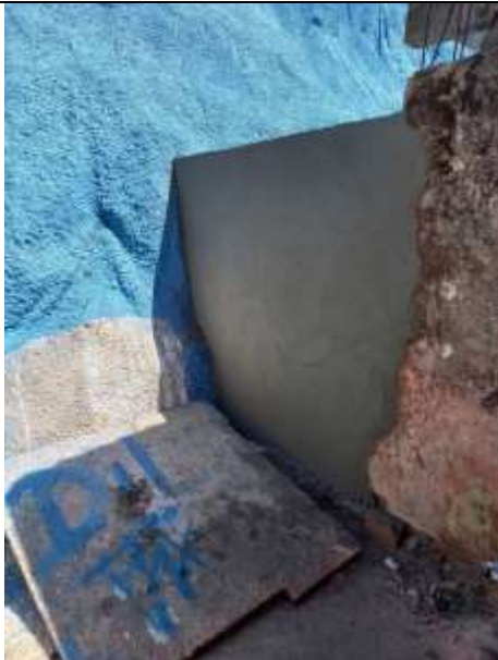
Alvenaria de vedação, chapisco emboço de muro – Santo Antônio.