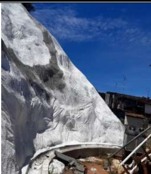
Drenagem com calha pré-moldada – Coqueirinho.