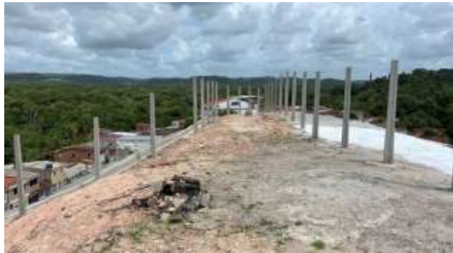
Cerca com Mourões no cume entre as barreiras de Santo Antônio e Coqueirinho.