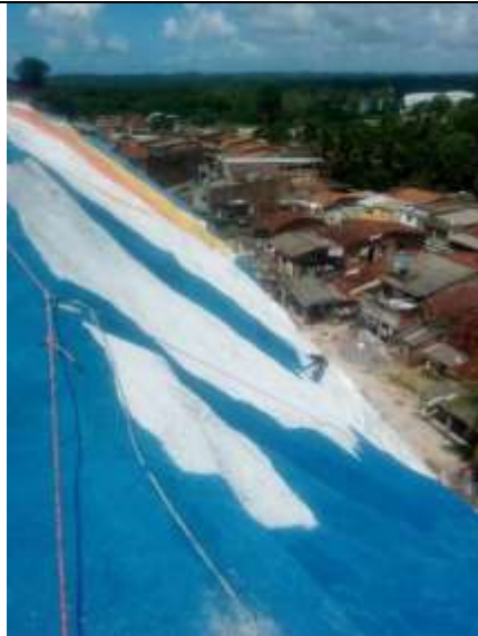
Pintura – Barreira da Rua Coqueirinho.