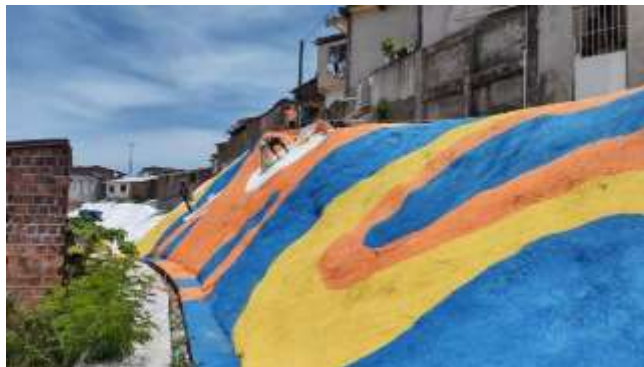
Pintura – Barreira da Rua 21 de Abril