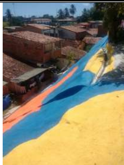
Pintura – Barreira da Rua Santo Antônio.