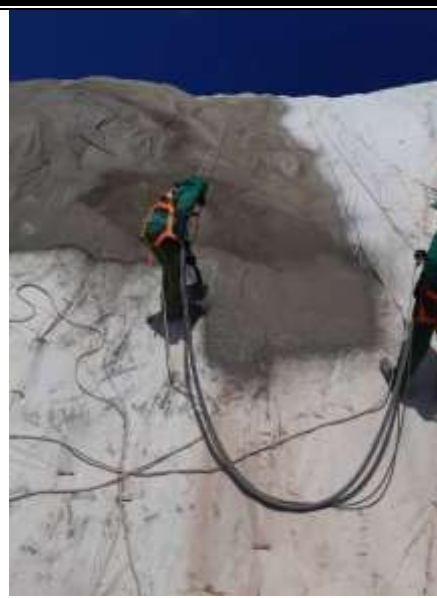
Aplicação de Geocomposto PVC e chapisco – Coqueirinho.