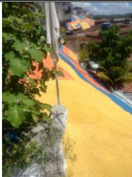
Pintura – Barreira da Rua 21 de Abril