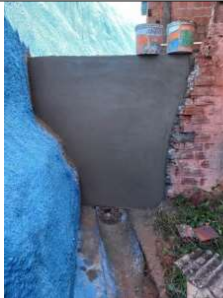
Alvenaria de vedação, chapisco emboço de muro – Santo Antônio.