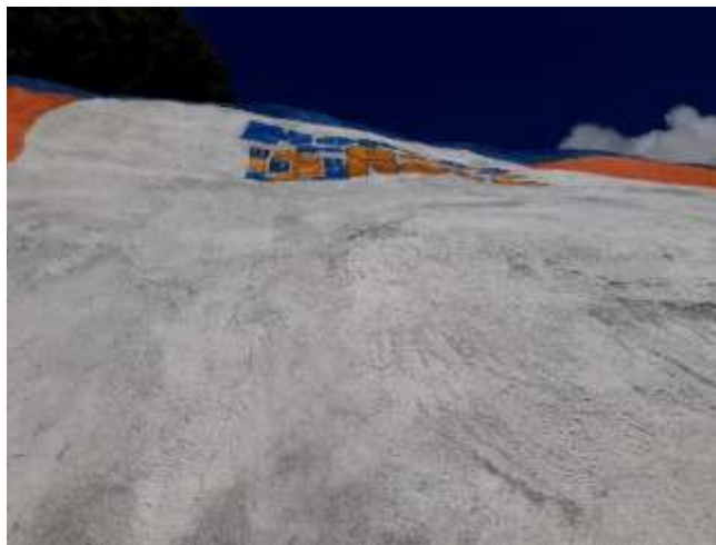
Pintura – Barreira da Rua Santo Antônio.