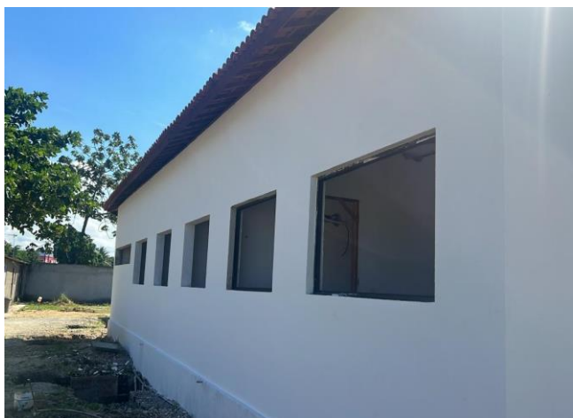
Aplicação E Lixamento De Massa Látex Em Paredes, Uma Demão. Af_06/2014