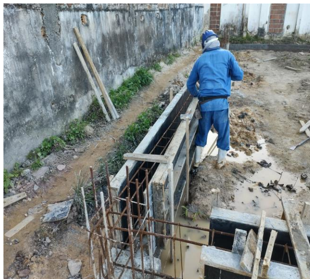
Fabricação, Montagem E Desmontagem De Fôrma Para Viga Baldrame, Em Madeira Serrada, E=25 Mm, 4 Utilizações. Af_06/2017