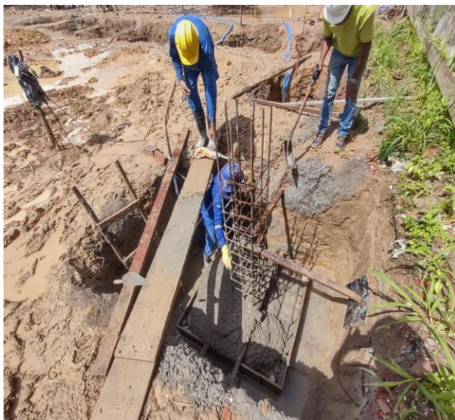
Fabricação, Montagem E Desmontagem De Fôrma Para Sapata, Em Madeira Serrada, E=25 Mm, 4 Utilizações. Af_06/2017