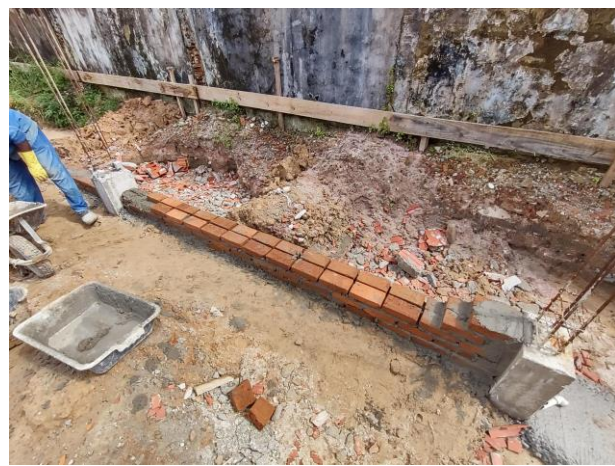
Alvenaria De Embasamento Em Tijolos Cerâmicos Maciços 5X10X20Cm, Assentado Com Argamassa Traço 1:2:8 (Cimento, Cal E Areia)