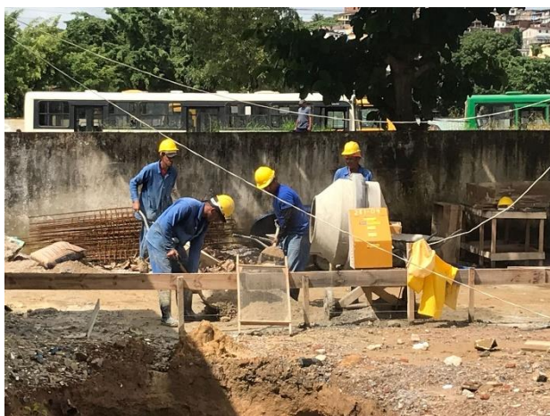
Concreto Fck = 30Mpa, Traço 1:2,1:2,5 (Em Massa Seca De Cimento/ Areia Média/ Brita 1) - Preparo Mecânico Com Betoneira 400 L. Af_05/2021