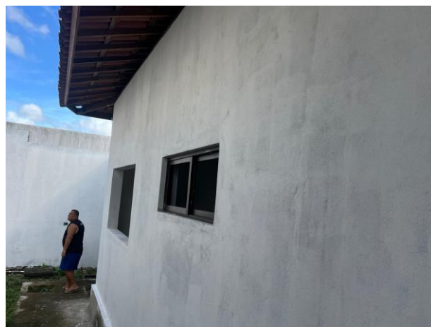
Aplicação De Fundo Selador Acrílico Em Paredes, Uma Demão.