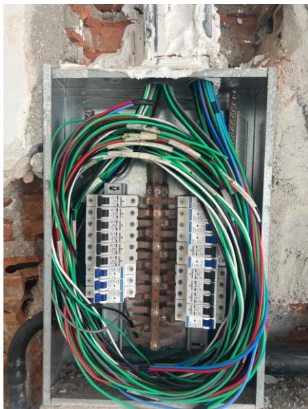
Cabo De Cobre Flexível Isolado, 2,5 Mm 2 , Antichama 450/750 V, Para Circuitos Terminais - Fornecimento E Instalação. Af_12/2015