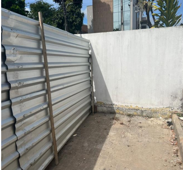
Tapume Com Telha Metálica. Af_05/2018