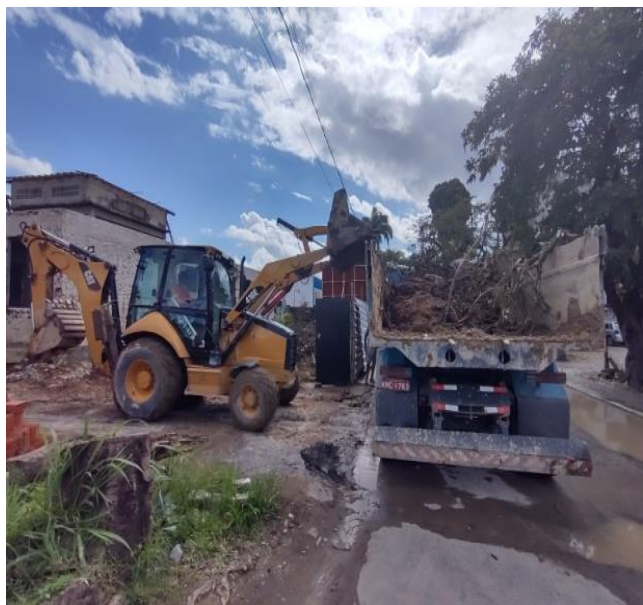
Transporte Com Caminhão Basculante De 10 M 3 , Em Via Urbana Pavimentada, Dmt Até 30 Km (Unidade: M3Xkm). Af_07/2020