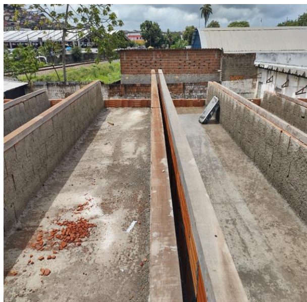
Trama De Madeira Composta Por Terças Para Telhados De Até 2 Águas Para Telha Ondulada De Fibrocimento, Metálica, Plástica Ou Termoacústica,