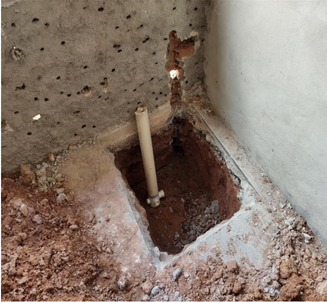
Caixa Sifonada, Pvc, Dn 100 X 100 X 50 Mm, Fornecida E Instalada Em Ramais De Encaminhamento De Água Pluvial. Af_12/2014