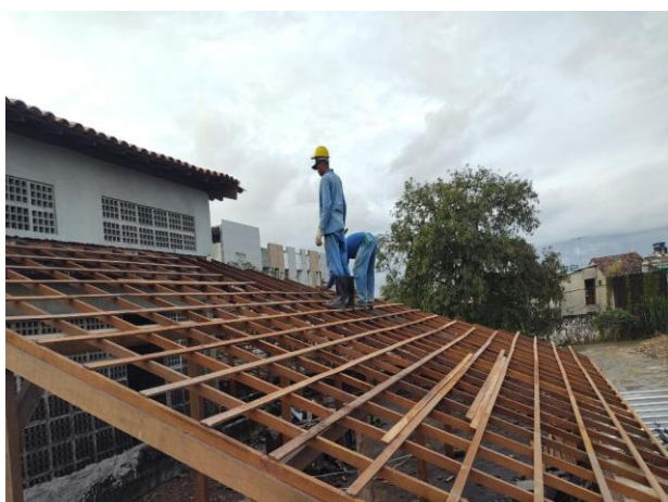
Trama De Madeira Composta Por Ripas, Caibros E Terças Para Telhados De Mais Que 2 Águas Para Telha Cerâmica Capa-Canal, Incluso Transporte