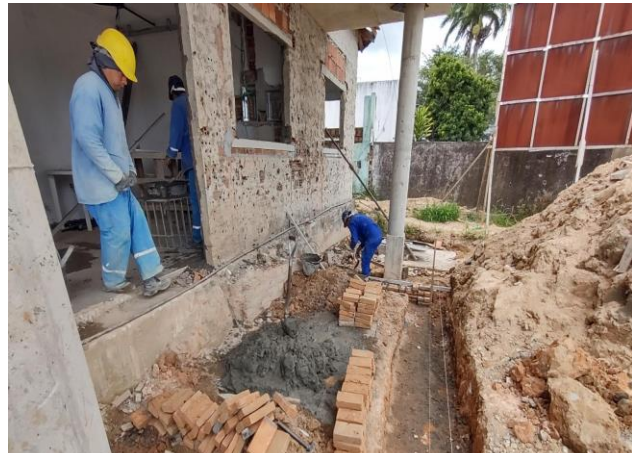
Alvenaria de embasamento em tijolos cerâmicos maciços 5x10x20cm, assentado com argamassa traço 1:2:8 (cimento, cal e areia).