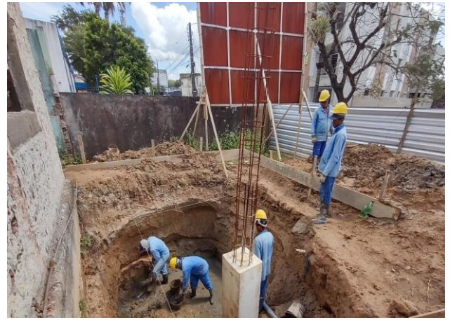
Escavação Manual Para Bloco De Coroamento Ou Sapata, Com Previsão De Fôrma. Af_06/2017