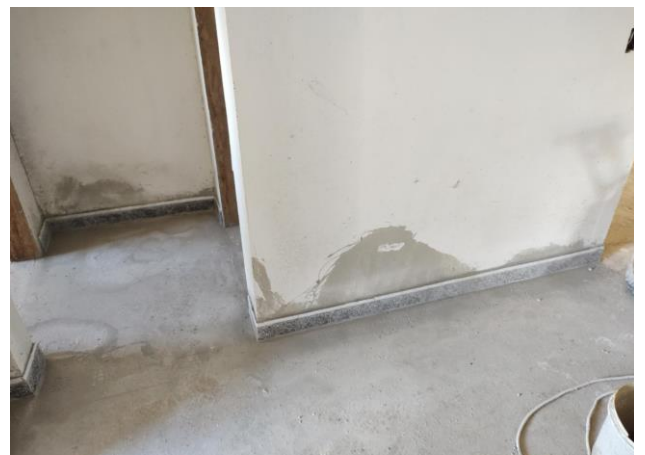
RODAPÉ EM GRANILITE, ALTURA 8 CM. AF_09/2020