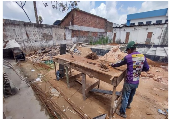
Armação De Pilar Ou Viga De Uma Estrutura Convencional De Concreto Armado Em Uma Edificação Térrea Ou Sobrado Utilizando Aço Ca-50 De 20,0 Mm - Montagem. Af_12/2015