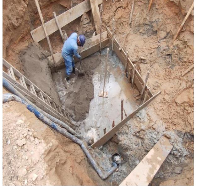
Solo-cimento 1:16, com compactação e espalhamento, mistura manual.