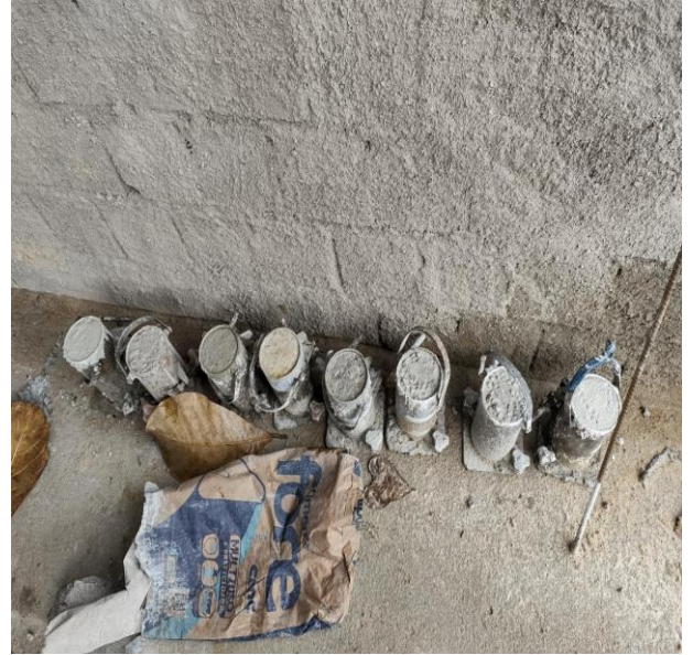
Ensaio de resistência a compressão simples - concreto.