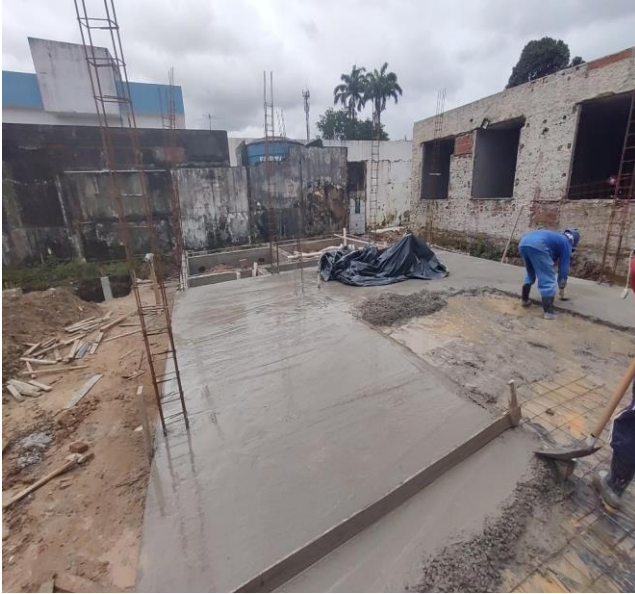
Laje do piso armada.