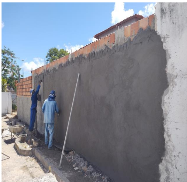
(Composição Representativa) Do Serviço De Emboço/Massa Única, Traço 1:2:8, Preparo Mecânico, Com Betoneira De 400l.