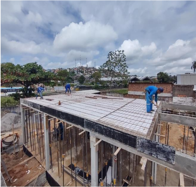
Montagem E Desmontagem De Fôrma De Laje Nervurada Com Cubeta E Assoalho, Pé-Direito Simples, Em Chapa De Madeira Compensada Resinada, 10 Utilizações. Af_09/2020