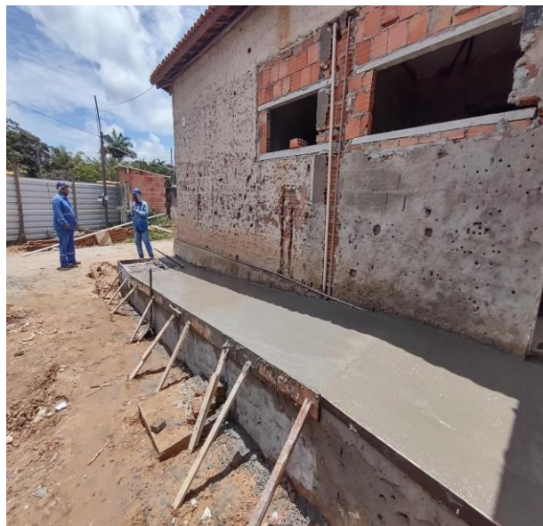
Chapisco Aplicado Em Alvenarias E Estruturas De Concreto Internas, Com Colher De Pedreiro. Argamassa Traço 1:3 Com Preparo Manual.