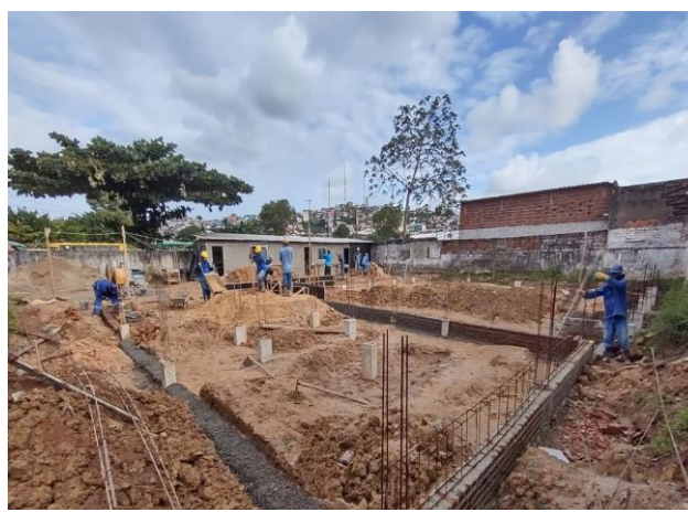
Lastro de concreto, preparo mecânico, inclusos aditivo impermeabilizante, lançamento e adensamento