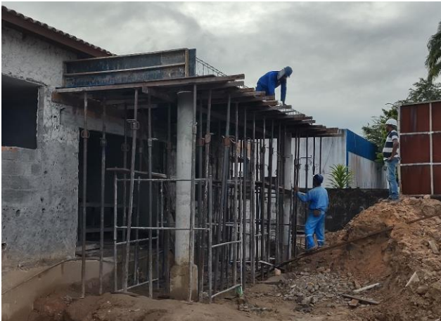
Montagem E Desmontagem De Fôrma De Viga, Escoramento Metálico, Pé-Direito Simples, Em Chapa De Madeira Resinada, 6 Utilizações. Af_09/2020