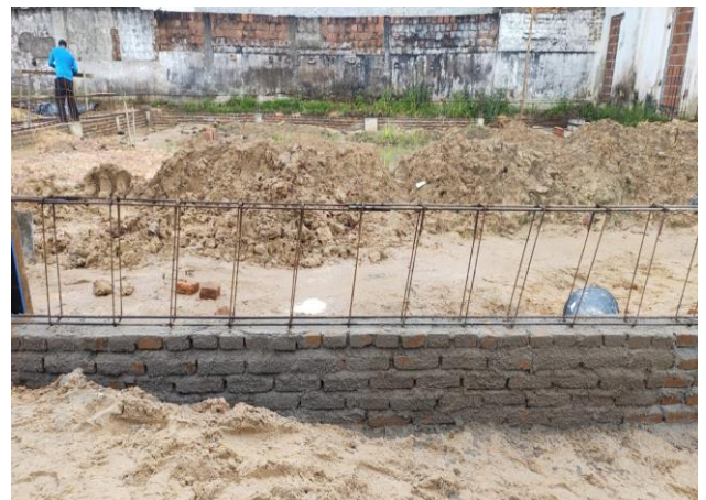
Chapisco Aplicado Em Alvenarias E Estruturas De Concreto Internas, Com Colher De Pedreiro. Argamassa Traço 1:3 Com Preparo Em Betoneira