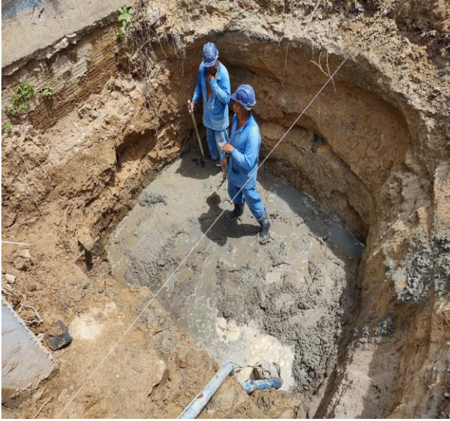
Esgotamento com bomba submersível elétrica trifásica acima 2 até 5 CV, inclusive gerador.