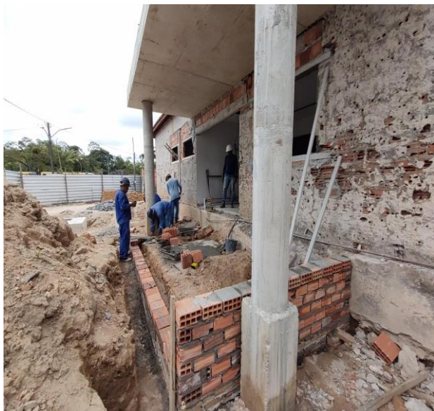
Alvenaria De Vedação De Blocos Cerâmicos Maciços De 5X10X20Cm (Espessura 10Cm) E Argamassa De Assentamento Com Preparo Em Betoneira. Af_05/2020