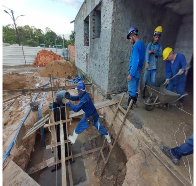
Lançamento Com Uso De Baldes, Adensamento E Acabamento De Concreto Em Estruturas. Af_12/2015