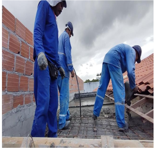
Armação De Bloco, Viga Baldrame Ou Sapata Utilizando Aço Ca-50 De 6,3 Mm - Montagem. Af_06/2017