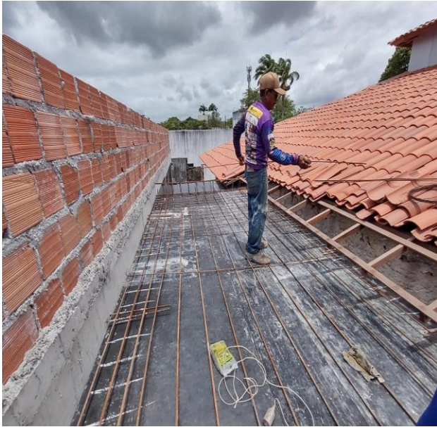
Armação De Bloco, Viga Baldrame E Sapata Utilizando Aço Ca-60 De 5 Mm - Montagem. Af_06/2017