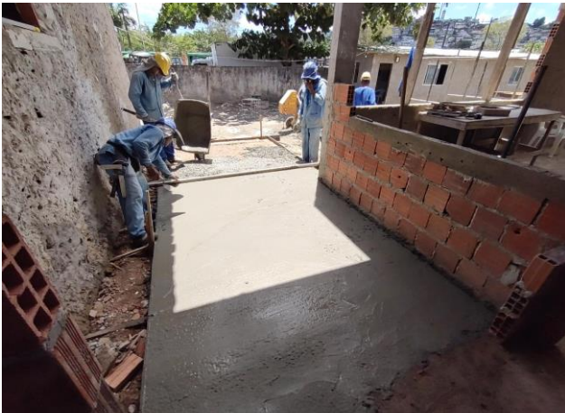
Execução De Passeio (Calçada) Ou Piso De Concreto Com Concreto Moldado In Loco, Feito Em Obra, Acabamento Convencional, Espessura 6 Cm, Armado. Af_07/2016