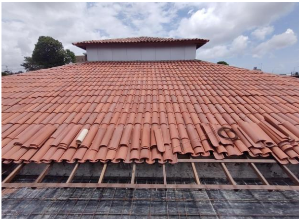
Armação De Bloco, Viga Baldrame Ou Sapata Utilizando Aço Ca-50 De 10 Mm - Montagem. Af_06/2017