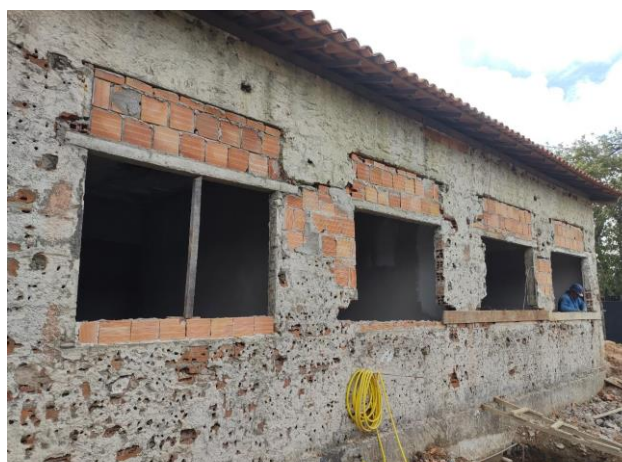
Contraverga Pré-Moldada Para Vãos De Mais De 1,5 M De Comprimento. Af_03/2016