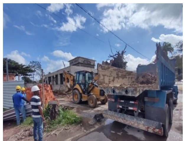
Carga, Manobra E Descarga De Entulho Em Caminhão Basculante 6 M 3 - Carga Com Escavadeira Hidráulica