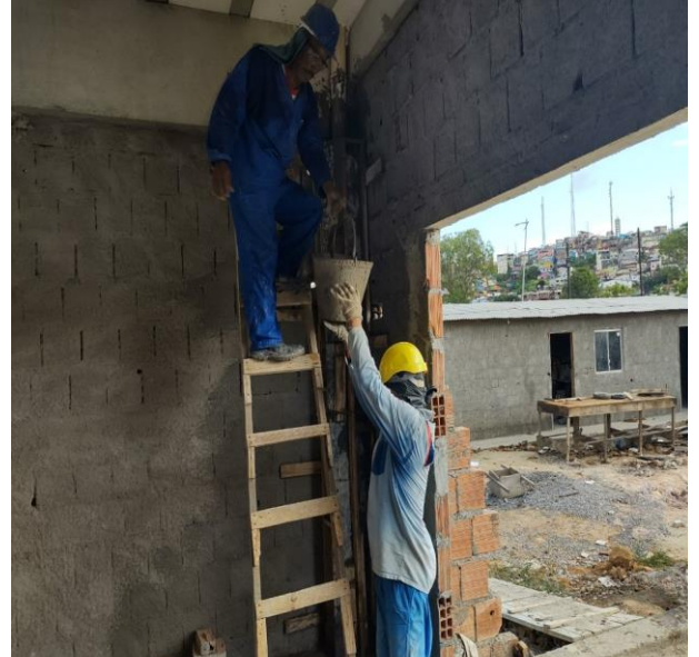
Lançamento Com Uso De Baldes, Adensamento E Acabamento De Concreto Em Estruturas. Af_12/2015