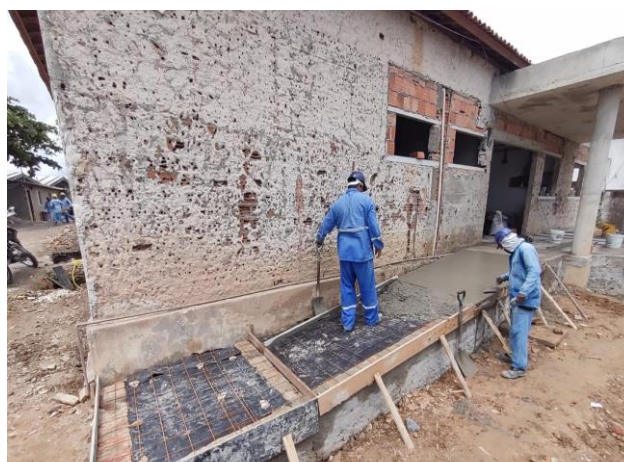
Concreto Fck = 25Mpa, Traço 1:2,3:2,7 (Em Massa Seca De Cimento/ Areia Média/ Brita 1) - Preparo Mecânico Com Betoneira 400 L. Af_05/2021