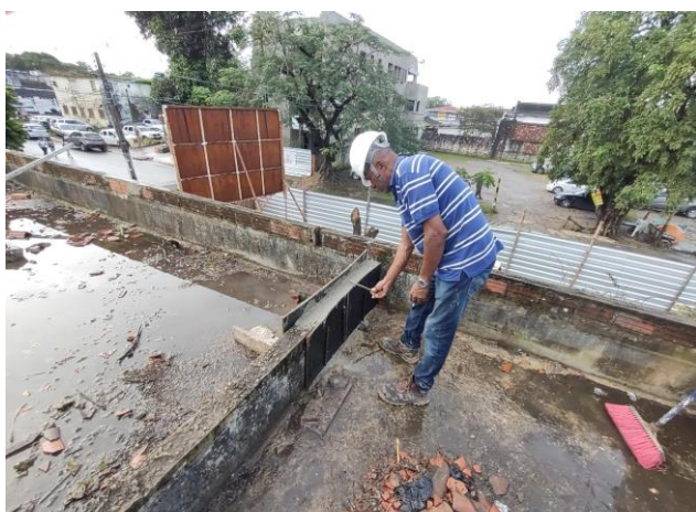
GRAUTE FGK=30 (CIMENTO/ AREIA GROSSA/ BRITA 0/ ADITIVO)