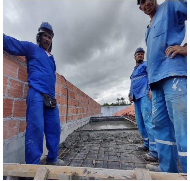
Armação De Pilar Ou Viga De Uma Estrutura Convencional De Concreto Armado Em Uma Edificação Térrea Ou Sobrado Utilizando Aço Ca-60 De 5,0 Mm - Montagem. Af_12/2015