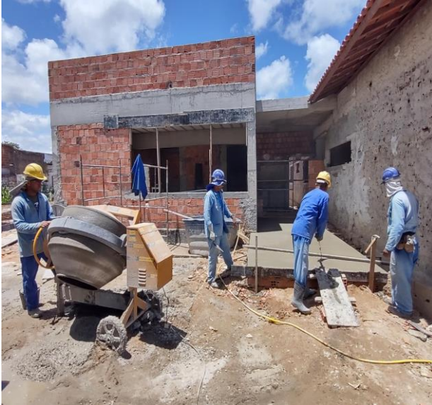
Lançamento Com Uso De Baldes, Adensamento E Acabamento De Concreto Em Estruturas. Af_12/2015