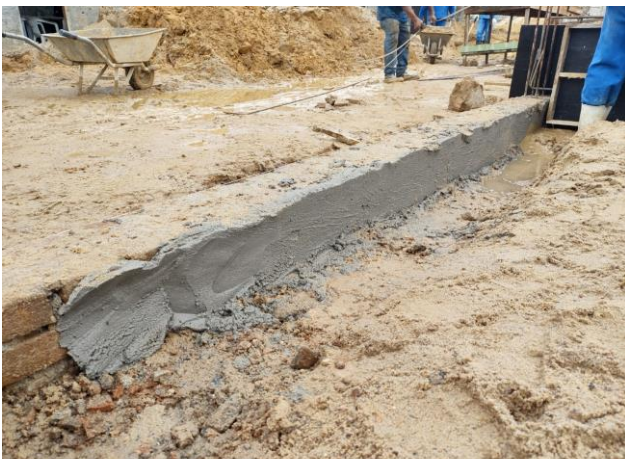
Massa Única, Para Recebimento De Pintura, Em Argamassa Traço 1:2:8, Preparo Mecânico Com Betoneira 400.