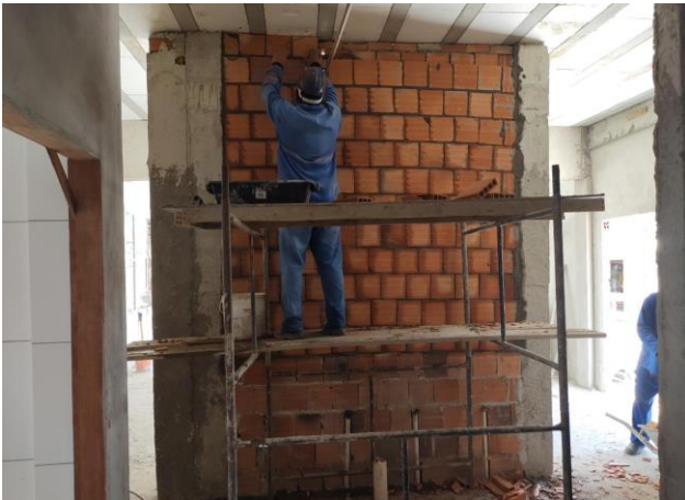
(Composição Representativa) Do Serviço De Alvenaria De Vedação De Blocos Vazados De Cerâmica De 9X19X19Cm (Espessura 9Cm), Para Edificação Habitacional Unifamiliar (Casa) E Edificação Pública Padrão.