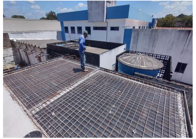
Montagem E Desmontagem De Fôrma De Laje Maciça, Pé-Direito Simples, Em Madeira Serrada, 4 Utilizações. Af_09/2020