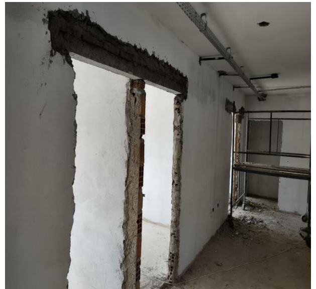
Verga Pré-Moldada Para Portas Com Até 1,5 M De Vão. Af_03/2016