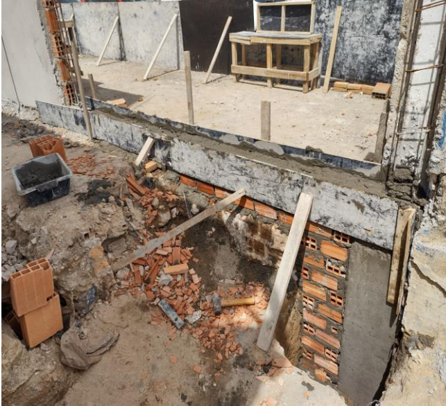
Concreto Fck = 30Mpa, Traço 1:2,1:2,5 (Em Massa Seca De Cimento/ Areia Média/ Brita 1) - Preparo Mecânico Com Betoneira 400 L. Af_05/2021