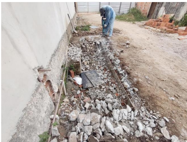
Demolição de concreto manualmente