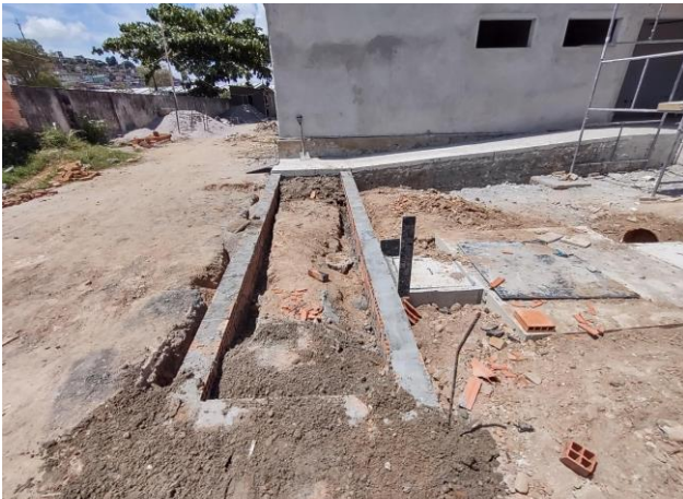
Reaterro Manual De Valas Com Compactação Mecanizada. Af_04/2016