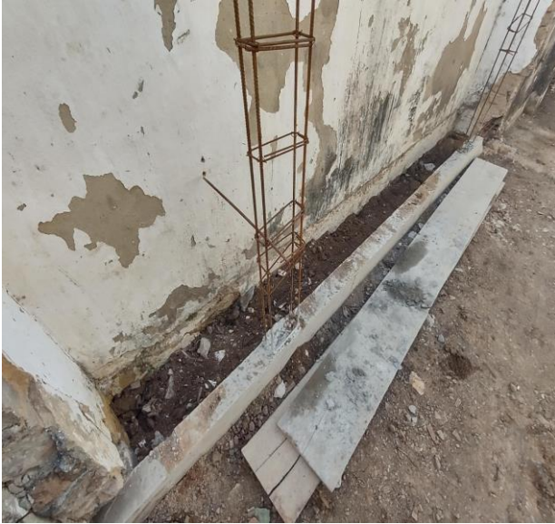
Reaterro Manual De Valas Com Compactação Mecanizada. Af_04/2016