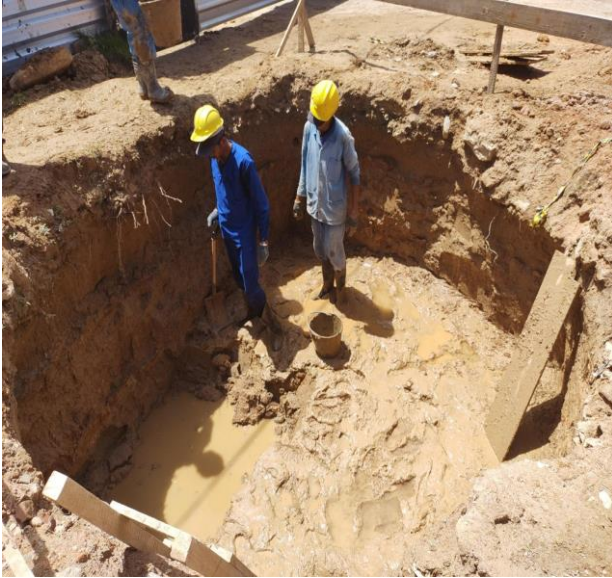
Escavação Manual Para Bloco De Coroamento Ou Sapata, Com Previsão De Fôrma. Af_06/2017