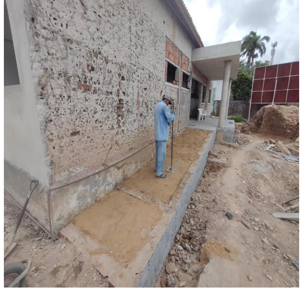
Aterro com areia com adensamento hidráulico