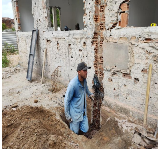
Demolição De Alvenaria De Bloco Furado, De Forma Manual, Sem Reaproveitamento. Af_12/2017