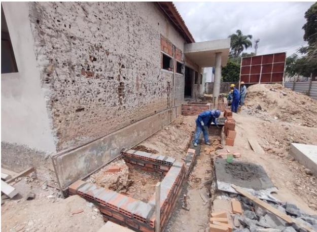
Lastro de concreto, preparo mecânico, inclusos aditivo impermeabilizante, lançamento e adensamento