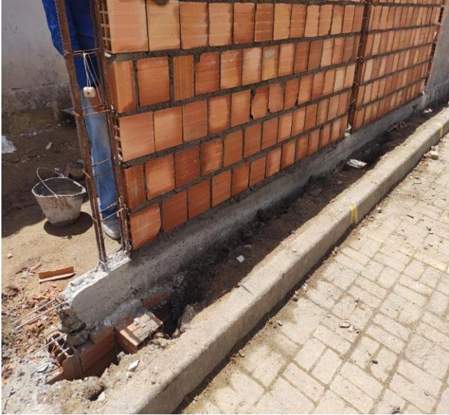
Reaterro Manual De Valas Com Compactação Mecanizada. Af_04/2016