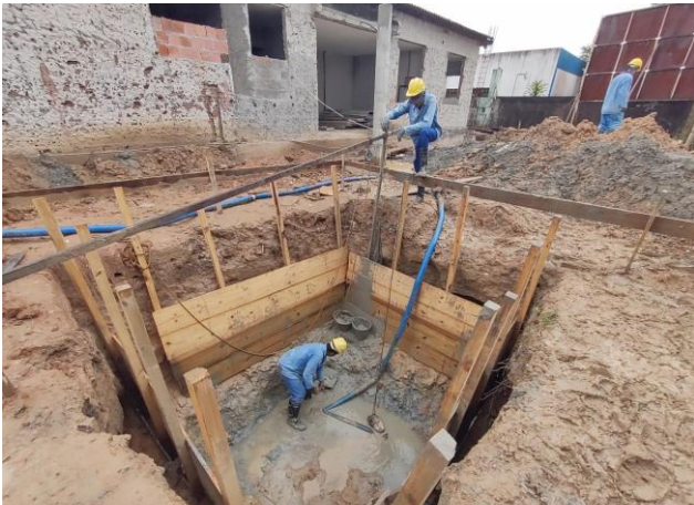
Escoramento de valas com pranchões metlicos - área cravada