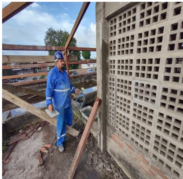
TRATAMENTO DE FISSURAS COM ARGAMASSA DE CIMENTO E AREIA.