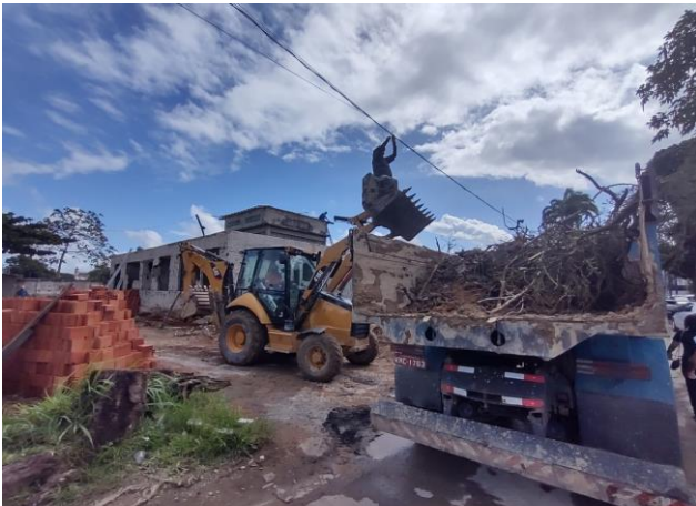
Transporte Com Caminhão Carroceria 9T, Em Via Urbana Pavimentada, Dmt Até 30Km (Unidade: Txkm). Af_07/2020 Ambientes Internos.