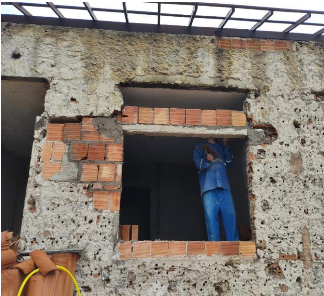
Verga Pré-Moldada Para Janelas Com Mais De 1,5 M De Vão. Af_03/2016