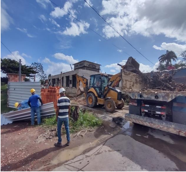
Transporte Com Caminhão Basculante De 6 M 3 , Em Via Urbana Pavimentada, Dmt Até 30 Km (Unidade: M3Xkm). Af_07/2020