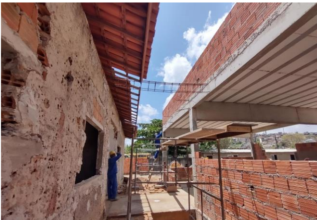
Armação De Pilar Ou Viga De Uma Estrutura Convencional De Concreto Armado Em Uma Edificação Térrea Ou Sobrado Utilizando Aço Ca-50 De 8,0 Mm - Montagem. Af_12/2015