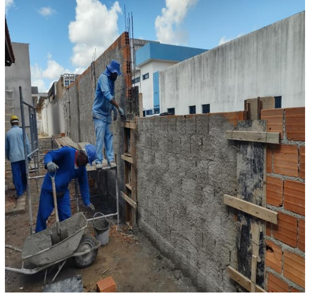
Montagem E Desmontagem De Fôrma De Pilares Retangulares E Estruturas Similares, Pé-Direito Simples, Em Chapa De Madeira Compensada Resinada, 6 Utilizações. Af_09/2020