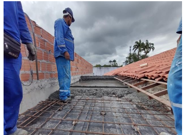
Armação De Bloco, Viga Baldrame Ou Sapata Utilizando Aço Ca-50 De 12,5 Mm - Montagem. Af_06/2017