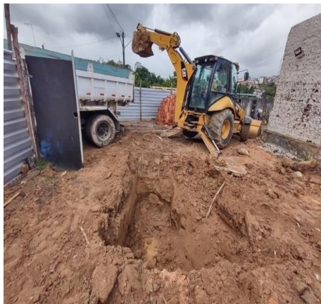
Destinação de material de 1ª categoria proveniente de escavação para Bota Fora