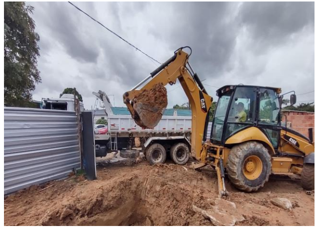
Destinação de material de 1ª categoria proveniente de escavação para Bota Fora