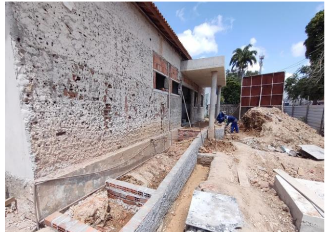
Escavação Manual Para Bloco De Coroamento Ou Sapata, Sem Previsão De Fôrma. Af_06/2017