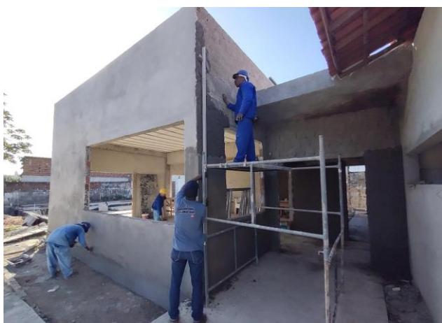
(Composição Representativa) Do Serviço De Emboço/Massa Única, Traço 1:2:8, Preparo Mecânico, Com Betoneira De 400L.