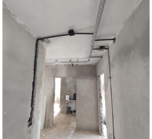
Eletroduto Rígido Roscável, Pvc, Dn 25 Mm (3/4"), Para Circuitos Terminais, Instalado Em Laje - Fornecimento E Instalação. Af_12/2015