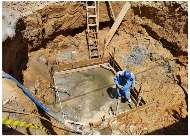
Lastro de concreto, preparo mecânico, inclusos aditivo impermeabilizante, lançamento e adensamento