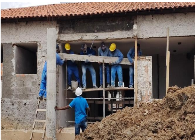
Verga Pré-Moldada Para Portas Com Mais De 1,5 M De Vão. Af_03/2016