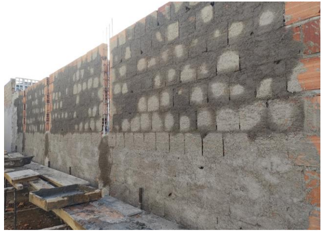
Chapisco Aplicado Em Alvenarias E Estruturas De Concreto Internas, Com Rolo Para Textura Acrílica.