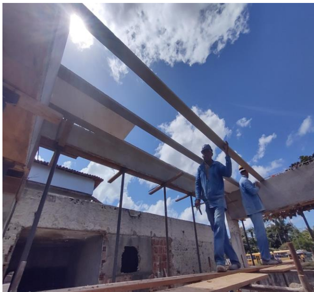
Laje pre-moldada TR08644 . Inclui vigotas treliçada, enchimento em EPS, tela Q92, escoramento, materiais e mão de obra. Não inclui armadura negativa.