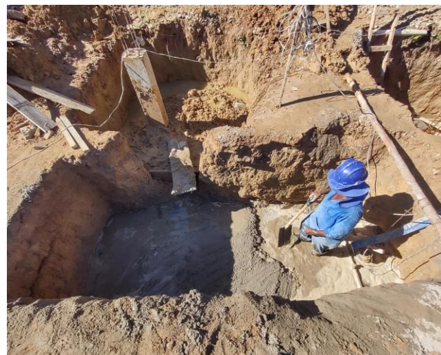
Lastro De Concreto Magro, Aplicado Em Blocos De Coroamento Ou Sapatas. Af_08/2017