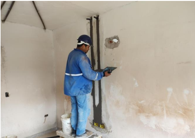
Caixa Retangular 4" X 2" Baixa (0,30 M Do Piso), Pvc, Instalada Em Parede - Fornecimento E Instalação. Af_12/2015