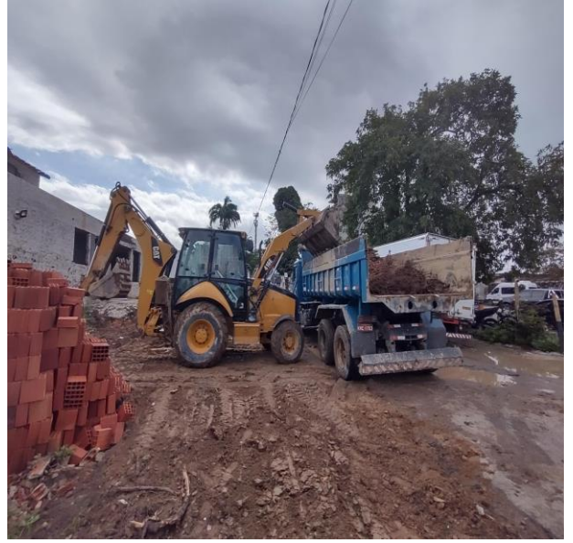
Carga, Manobra E Descarga De Solos E Materiais Granulares Em Caminhão Basculante 6 M 3 - Carga Com Escavadeira Hidráulica.