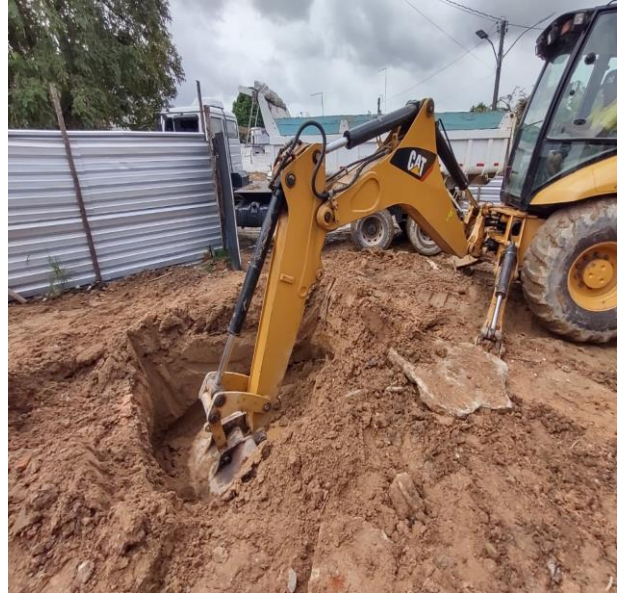
Destinação de material de 1ª categoria proveniente de escavação para Bota Fora