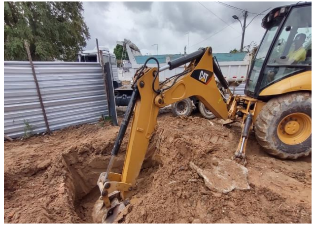
Carga, Manobra E Descarga De Solos E Materiais Granulares Em Caminhão Basculante 6 M 3 - Carga Com Escavadeira Hidráulica (Caçamba De 1,20 M 3 / 155 Hp) E Descarga Livre (Unidade: M3). Af_07/202